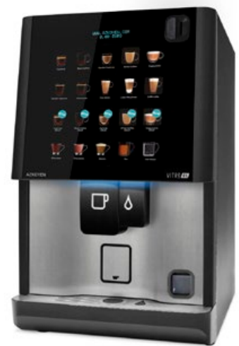
Integración para sistemas MDB de devolución de monedas en máquina