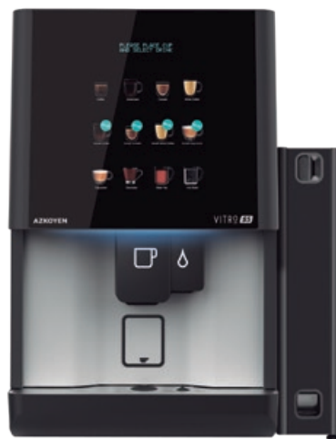
Módulo exterior para la instalación de medios de pago MDB