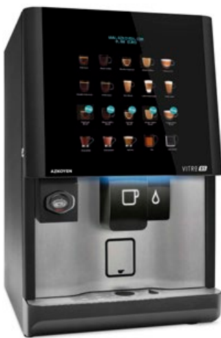
Kit de Integración para sistemas cashless MDB en máquina

La máquina es compatible con Pay4Vend permitiendo el pago directamente desde el móvil.