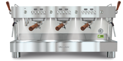
3GR Full Inox